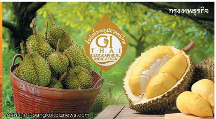
กรุงเทพฯธุรกิจ